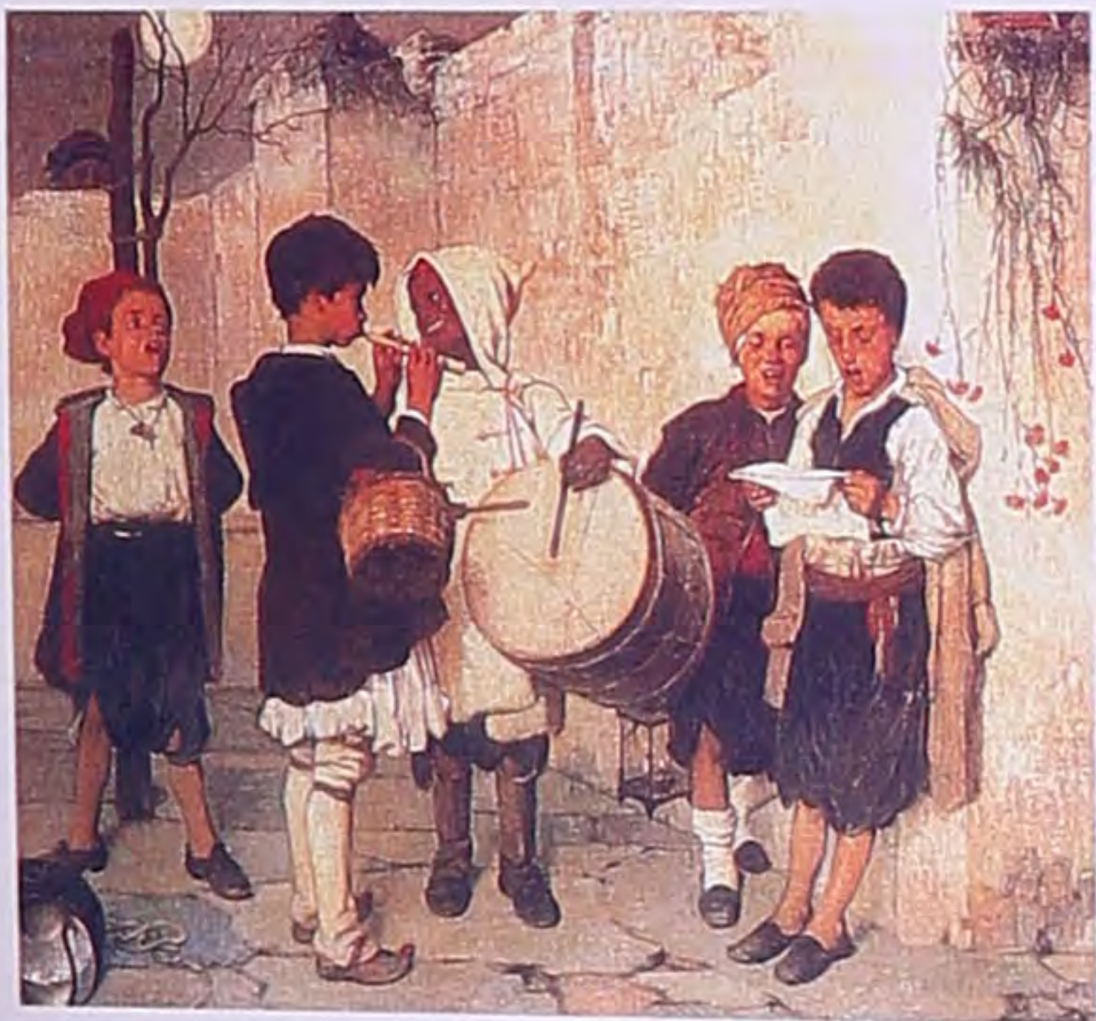
Τα Κάλαντα. Ελαιογραφία (τμήμα) του Ν. Λύτρα, τέλη 19ου αιώνα.

Ανεξάρτητα από την προέλευσή τους, τα όργανα που με τη συνοδεία τους ο λαός μας τραγούδησε τις